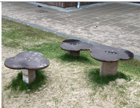
Redskab: Balanceplader Årgang: 2024 Producent: Kompan Er redskabet mærket: Ja Er der registreret fejl/mangler: Nej