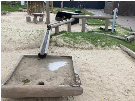
Redskab: Vandleg Årgang: 2024 Producent: Kompan Er redskabet mærket: Ja Er der registreret fejl/mangler: Nej