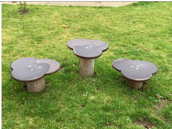
Redskab: Balanceplader Årgang: 2024 Producent: Kompan Er redskabet mærket: Ja Er der registreret fejl/mangler: Nej