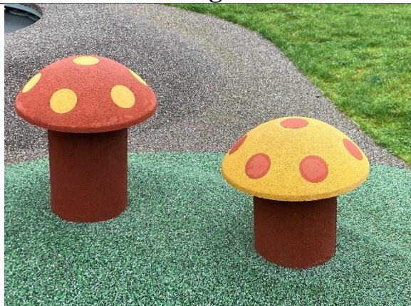
Redskab: Balancesvampe Årgang: 2024 Producent: Kompan Er redskabet mærket: Ja Er der registreret fejl/mangler: Nej