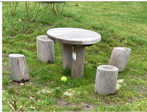
Redskab: Legebord med stole Årgang: 2024 Producent: Kompan Er redskabet mærket: Ja Er der registreret fejl/mangler: Nej