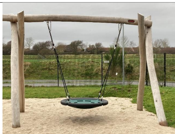
Redskab: Fugleredegyng Årgang: 2024 Producent: Kompan Er redskabet mærket: Ja Er der registreret fejl/mangler: Nej