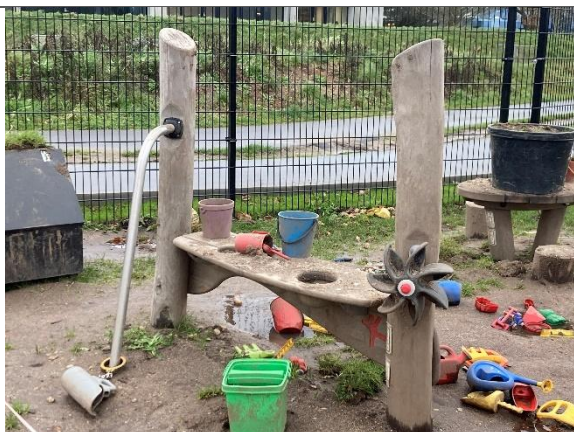
Redskab: Sandleg Årgang: 2024 Producent: Kompan Er redskabet mærket: Ja Er der registreret fejl/mangler: Nej