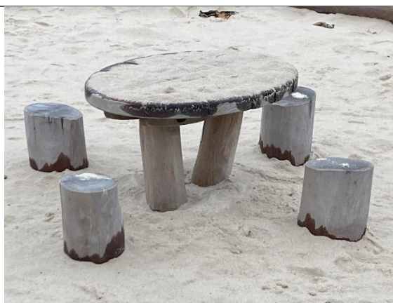
Redskab: Legebord med stole Årgang: 2024 Producent: Kompan Er redskabet mærket: Ja Er der registreret fejl/mangler: Nej