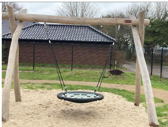
Redskab: Fugleredegyng Årgang: 2024 Producent: Kompan Er redskabet mærket: Ja Er der registreret fejl/mangler: Nej