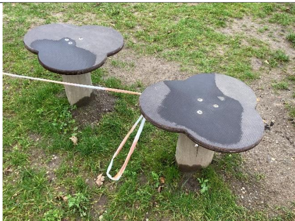
Redskab: Balanceplader Årgang: 2024 Producent: Kompan Er redskabet mærket: Ja Er der registreret fejl/mangler: Nej