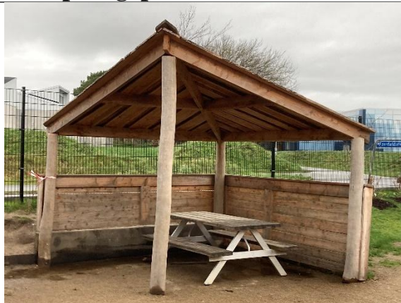
Redskab: Madpakkehus Årgang: 2024 Producent: Kompan Er redskabet mærket: Ja Er der registreret fejl/mangler: Nej