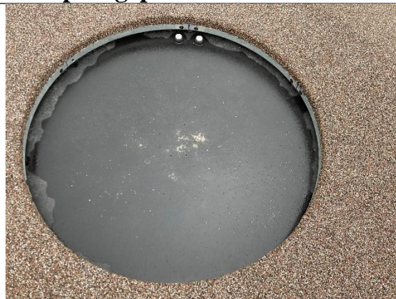
Redskab: Hopperedskab Årgang: 2024 Producent: Kompan Er redskabet mærket: Ja Er der registreret fejl/mangler: Nej