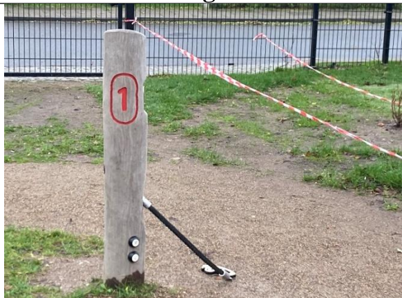
Redskab: Benzinstander Årgang: 2024 Producent: Kompan Er redskabet mærket: Ja Er der registreret fejl/mangler: Nej