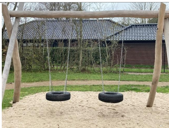
Redskab: Gyngestativ Årgang: 2024 Producent: Kompan Er redskabet mærket: Ja Er der registreret fejl/mangler: Nej