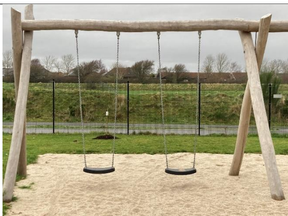
Redskab: Gyngestativ Årgang: 2024 Producent: Kompan Er redskabet mærket: Ja Er der registreret fejl/mangler: Nej