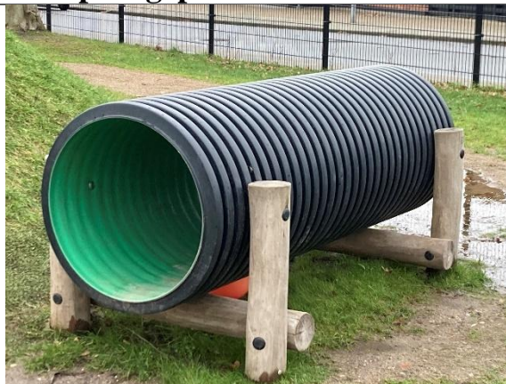
Redskab: Tunnel Årgang: 2024 Producent: Kompan Er redskabet mærket: Ja Er der registreret fejl/mangler: Nej