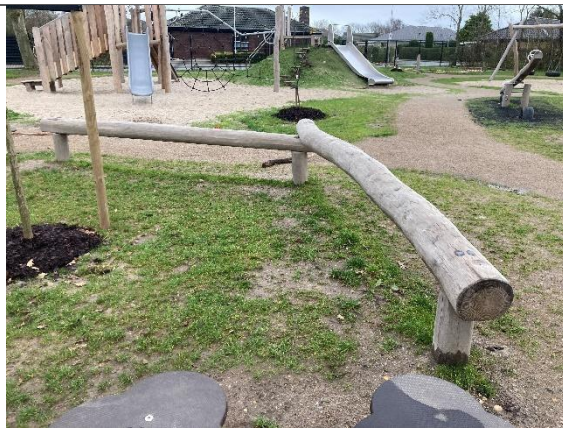
Redskab: Balancebomme Årgang: 2024 Producent: Kompan Er redskabet mærket: Ja Er der registreret fejl/mangler: Nej