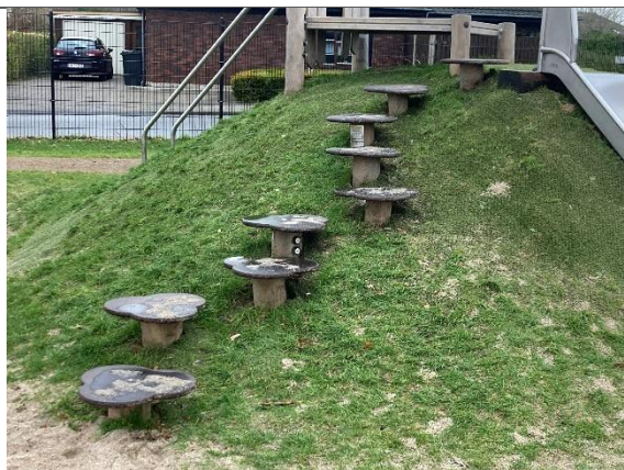
Redskab: Balanceplader Årgang: 2024 Producent: Kompan Er redskabet mærket: Ja Er der registreret fejl/mangler: Nej