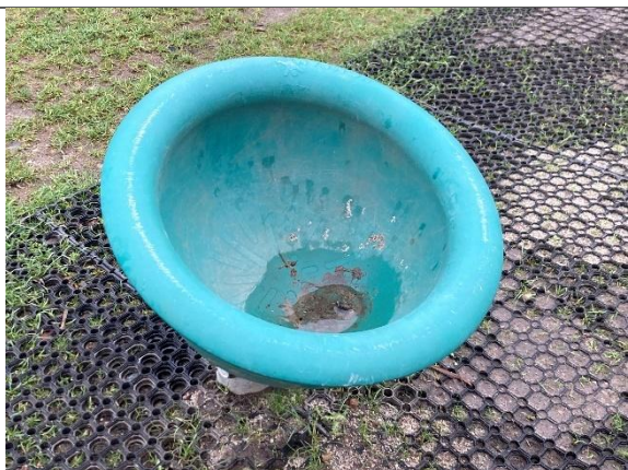
Redskab: Tekop Årgang: 2024 Producent: Kompan Er redskabet mærket: Ja Er der registreret fejl/mangler: Nej