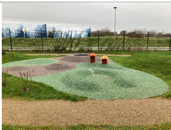
Redskab: Kupperet gummibane Årgang: 2024 Producent: Kompan Er redskabet mærket: Ja Er der registreret fejl/mangler: Nej