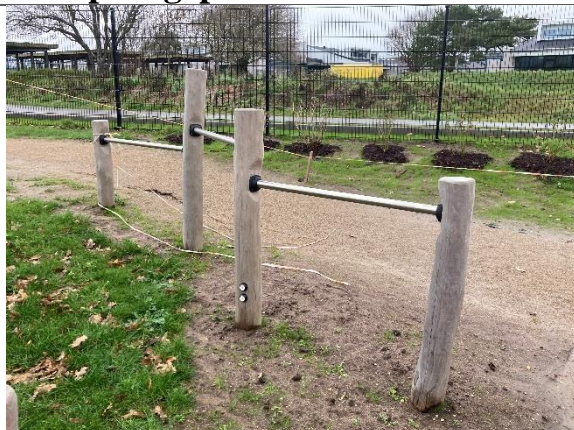
Redskab: Svingbomme Årgang: 2024 Producent: Kompan Er redskabet mærket: Ja Er der registreret fejl/mangler: Nej