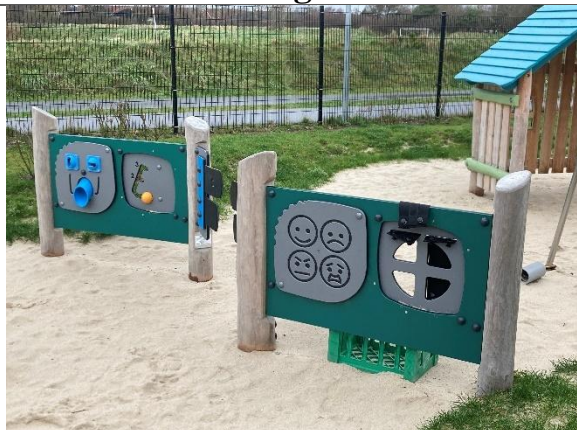
Redskab: Aktivitetsvægge Årgang: 2024 Producent: Kompan Er redskabet mærket: Ja Er der registreret fejl/mangler: Nej