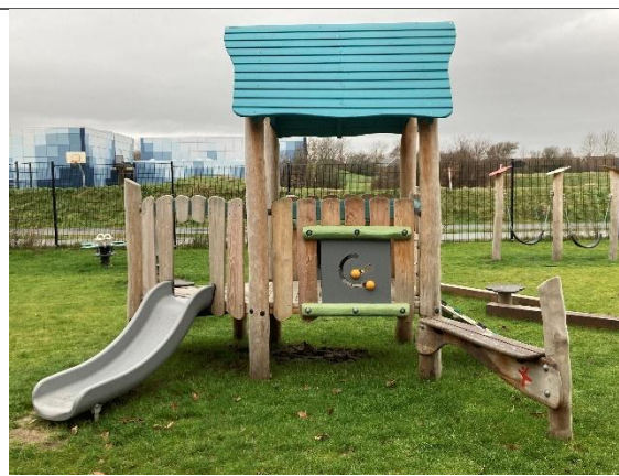
Redskab: Klatrestativ med rutsjebane Årgang: 2024 Producent: Kompan Er redskabet mærket: Ja Er der registreret fejl/mangler: Nej