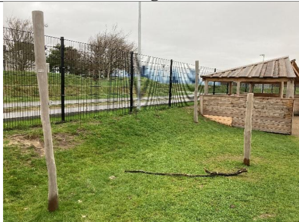
Redskab: Stolper til hængekøjer Årgang: 2024 Producent: Kompan Er redskabet mærket: Ja Er der registreret fejl/mangler: Nej