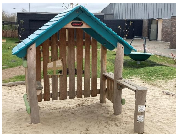
Redskab: Legehus Årgang: 2024 Producent: Kompan Er redskabet mærket: Ja Er der registreret fejl/mangler: Nej