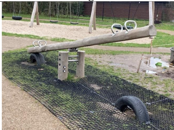
Redskab: Etpunktsvippe Årgang: 2024 Producent: Kompan Er redskabet mærket: Ja Er der registreret fejl/mangler: Nej