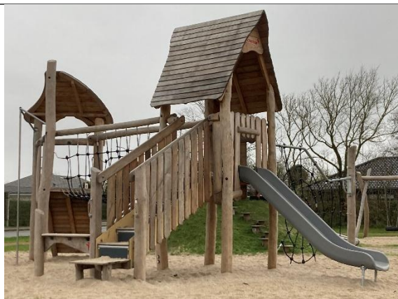
Redskab: Klatrestativ med rutsjebane Årgang: 2024 Producent: Kompan Er redskabet mærket: Ja Er der registreret fejl/mangler: Nej