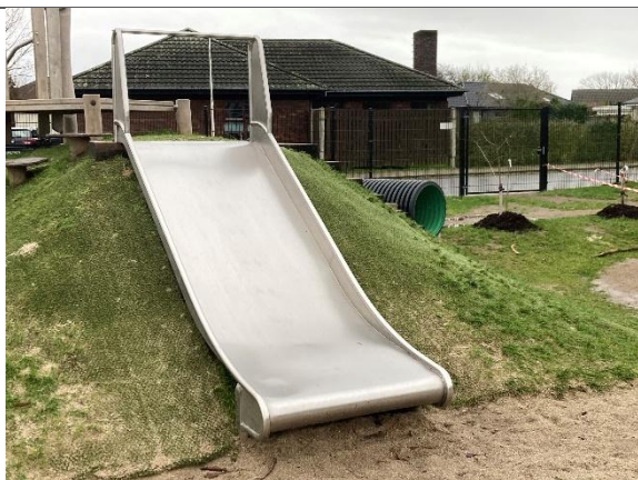
Redskab: Terrænrutsårbane Årgang: 2024 Producent: Kompan Er redskabet mærket: Ja Er der registreret fejl/mangler: Nej