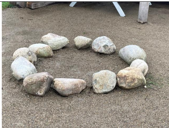
Redskab: Bålsted Ikke omfattet af DS/EN 1176