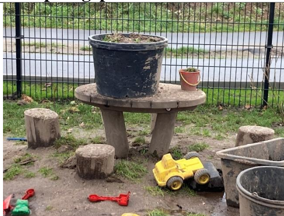
Redskab: Legebord med stole Årgang: 2024 Producent: Kompan Er redskabet mærket: Ja Er der registreret fejl/mangler: Nej