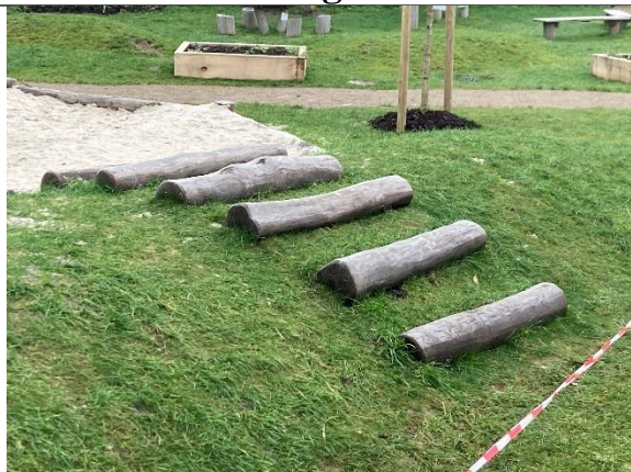
Redskab: Bjælkebro Årgang: 2024 Producent: Kompan Er redskabet mærket: Ja Er der registreret fejl/mangler: Nej