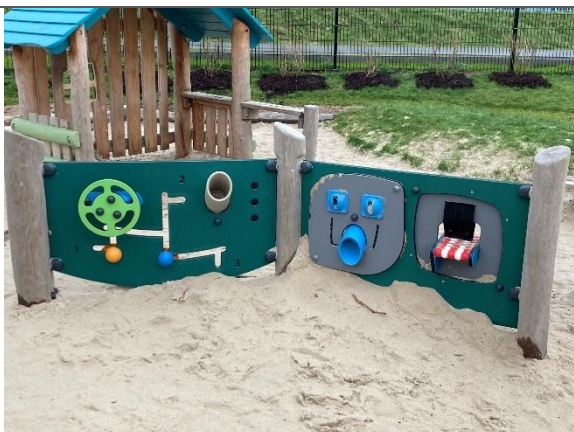
Redskab: Aktivitetsvægge Årgang: 2024 Producent: Kompan Er redskabet mærket: Ja Er der registreret fejl/mangler: Nej