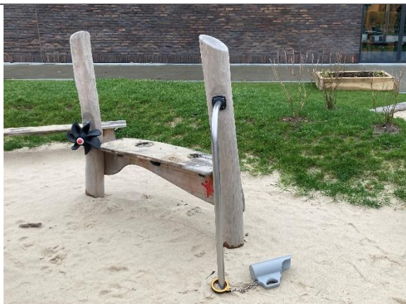
Redskab: Sandleg Årgang: 2024 Producent: Kompan Er redskabet mærket: Ja Er der registreret fejl/mangler: Nej