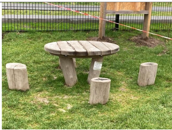
Redskab: Legebord med stole Årgang: 2024 Producent: Kompan Er redskabet mærket: Ja Er der registreret fejl/mangler: Nej