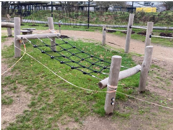
Redskab: Klatrenet Årgang: 2024 Producent: Kompan Er redskabet mærket: Ja Er der registreret fejl/mangler: Nej