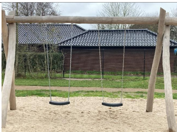
Redskab: Gyngestativ Årgang: 2024 Producent: Kompan Er redskabet mærket: Ja Er der registreret fejl/mangler: Nej