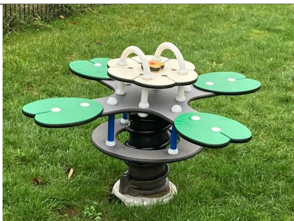
Redskab: Vippedyr Årgang: 2024 Producent: Kompan Er redskabet mærket: Ja Er der registreret fejl/mangler: Nej