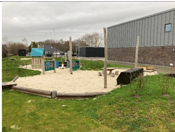
Redskab: Sandkasse med stolper til læsejl Årgang: 2024 Producent: Kompan Er redskabet mærket: Ja Er der registreret fejl/mangler: Nej