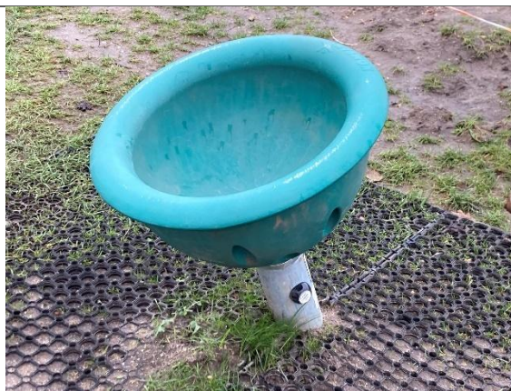
Redskab: Tekop Årgang: 2024 Producent: Kompan Er redskabet mærket: Ja Er der registreret fejl/mangler: Nej