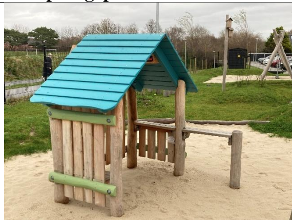
Redskab: Legehus Årgang: 2024 Producent: Kompan Er redskabet mærket: Ja Er der registreret fejl/mangler: Nej