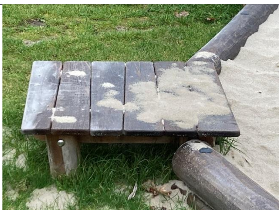
Redskab: Landgangsbro Årgang: 2024 Producent: Kompan Er redskabet mærket: Ja Er der registreret fejl/mangler: Nej