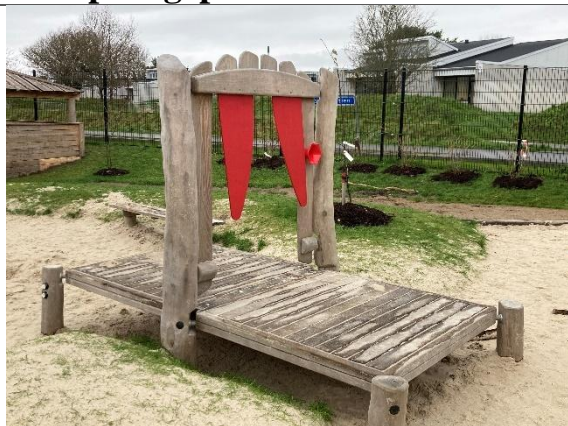
Redskab: Landgangsbro Årgang: 2024 Producent: Kompan Er redskabet mærket: Ja Er der registreret fejl/mangler: Nej