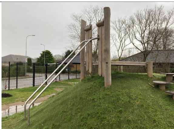
Redskab: Klatreleg Årgang: 2024 Producent: Kompan Er redskabet mærket: Ja Er der registreret fejl/mangler: Nej