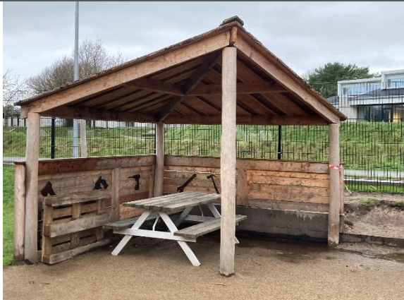
Redskab: Madpakkehus Årgang: 2024 Producent: Kompan Er redskabet mærket: Ja Er der registreret fejl/mangler: Nej