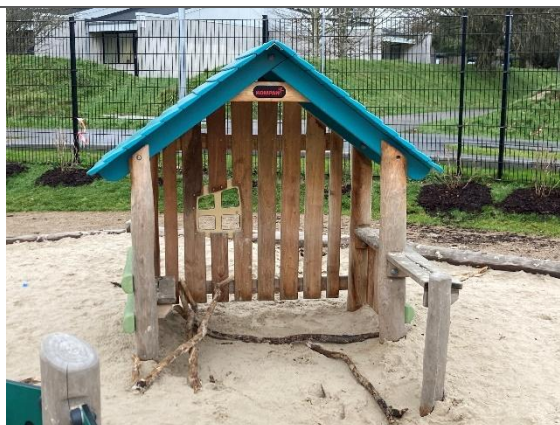
Redskab: Legehus Årgang: 2024 Producent: Kompan Er redskabet mærket: Ja Er der registreret fejl/mangler: Nej