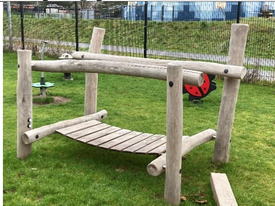
Redskab: Hængebro Årgang: 2024 Producent: Kompan Er redskabet mærket: Ja Er der registreret fejl/mangler: Nej