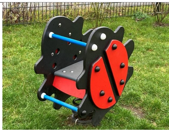
Redskab: Vippedyr Årgang: 2024 Producent: Kompan Er redskabet mærket: Ja Er der registreret fejl/mangler: Nej