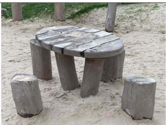
Redskab: Legebord med stole Årgang: 2024 Producent: Kompan Er redskabet mærket: Ja Er der registreret fejl/mangler: Nej