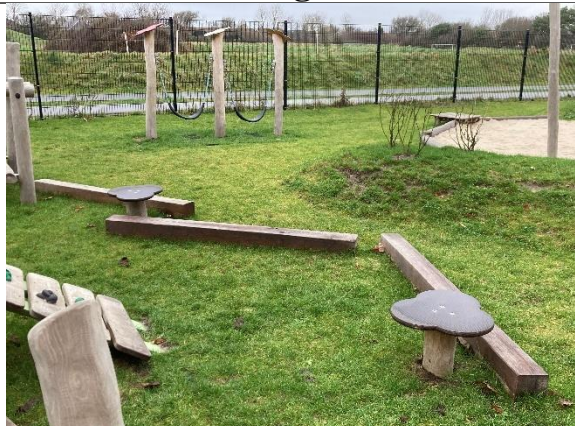
Redskab: Balanceforløb Årgang: 2024 Producent: Kompan Er redskabet mærket: Ja Er der registreret fejl/mangler: Nej