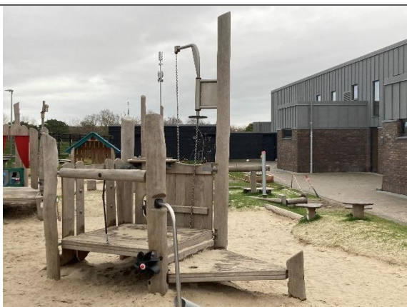
Redskab: Legeskib Årgang: 2024 Producent: Kompan Er redskabet mærket: Ja Er der registreret fejl/mangler: Nej