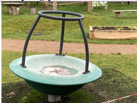
Redskab: Tipi-karussel Årgang: 2024 Producent: Kompan Er redskabet mærket: Ja Er der registreret fejl/mangler: Nej