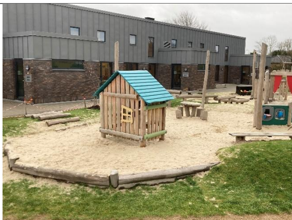
Redskab: Sandkasse med stolper til læsejl Årgang: 2024 Producent: Kompan Er redskabet mærket: Ja Er der registreret fejl/mangler: Nej